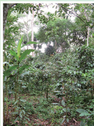
森林農法の農園の様子 中央の低木がコーヒーの木